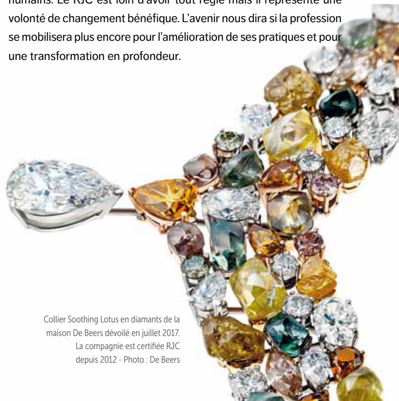
Collier Soothing Lotus en diamants de la maison De Beers dévoilé en juillet 2017. La compagnie est certifiée RJC depuis 2012

secteur de l'importance de rendre l'industrie plus vertueuse. Un bijou possède une charge émotionnelle importante et il n'est plus possible de continuer de l'associer à des dommages environnementaux et humains. Le RJC est loin d'avoir tout réglé mais il représente une volonté de changement bénéfique. L'avenir nous dira si la profession se mobilisera plus encore pour l'amélioration de ses pratiques et pour une transformation en profondeur.